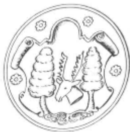
Das Wappen der Fürstlichen Freiheit Tragheim

Nachrichten durch, wie es jetzt in Königsberg aussieht. Die Ruine des Schlosses bildet immer noch den trostlosen Mittelpunkt der zerstörten Stadt. Die Umfassungsmauern der Schlosskirche stehen; ein zwanzig Meter langes Loch klafft im Turm. (Nach anderen, nicht überprüfbareren Meldungen soll der Turm gesprengt worden sein.) Das Universitätsgebäude und das Opernhaus sind Schuttstätten. Die Altstädtische Kirche — ein Schinkelbau — ist in ihren Umfassungsmauern erhalten. Von der ältesten Kirche Königsbergs, der Steindammer Kirche, ist nur ein Rest des Chorpolygon geblieben; ihr Turm wurde wegen Einsturzgefahr gesprengt. Der Turm des Domes erhebt sich noch, außer den Umfassungsmauern hat sich auch noch ein Gewölbejoch erhalten. Das Kantgrabmal hat die Stürme des Kriegsgeschehens überdauert, doch ist das Gitter verschwunden. Die Burgkirche sowie die Französische Kirche in der Königstraße sind ausgebrannt. Dass die Maraunenhöfer Ottokarkirche erhalten und als Kino von den Russen benutzt wird, haben wir bereits mehrfach berichtet. Die älteste Kirche des Samlandes, die Juditter (wir brachten im Januar eine Wiedergabe der wunderbaren Madonna, die dort stand) ist erhalten und zu einem Heimatmuseum umgewandelt worden. Wer solche Museen in Russland gesehen hat, weiß, dass sie lediglich als Propagandamittel für die Ideen des Bolschewismus dienen. Hinweise auf die siebenhundertjährige deutsche Kultur in Ostpreußen darf man in diesem „Heimatmuseum“ natürlich nicht erwarten.