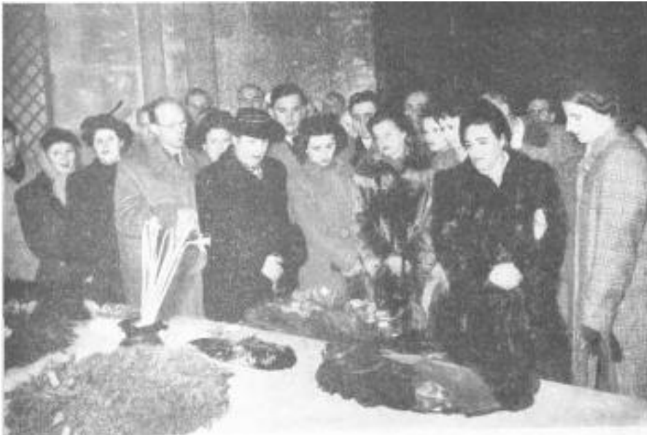
Ostpreußen vor dem Grabe Hindenburgs